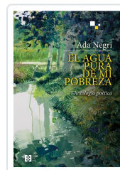
EL AGUA PURA DE MI POBREZA NEGRI, ADA