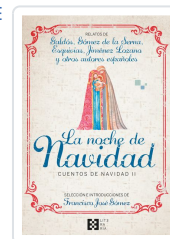
LA NOCHE DE NAVIDAD. CUENTOS DE NAVIDAD II GÓMEZ FERNÁNDEZ, FRANCISCO JOSÉ