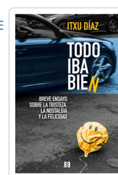
TODO IBA BIEN DÍAZ, ITXU