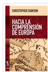
HACIA LA COMPRENSIÓN DE EUROPA DAWSON, CHRISTOPHER