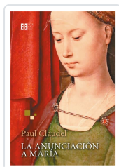
LA ANUNCIACIÓN A MARÍA CLAUDEL, PAUL