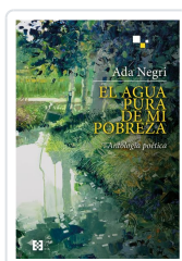
EL AGUA PURA DE MI POBREZA NEGRI, ADA