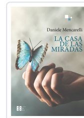
LA CASA DE LAS MIRADAS DANIELE MENCARELLI