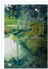
EL AGUA PURA DE MI POBREZA NEGRI, ADA