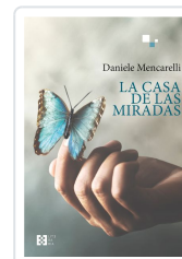
LA CASA DE LAS MIRADAS DANIELE MENCARELLI