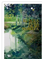
EL AGUA PURA DE MI POBREZA NEGRI, ADA