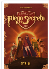
EL CLUB DEL FUEGO SECRETO / 3 BLANCO ALBAROVA, DIEGO