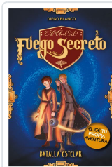
EL CLUB DEL FUEGO SECRETO / 4 BLANCO, DIEGO