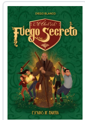
EL CLUB DEL FUEGO SECRETO / 2 BLANCO, DIEGO