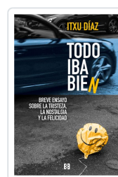
TODO IBA BIEN DÍAZ, ITXU