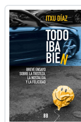
TODO IBA BIEN DÍAZ, ITXU