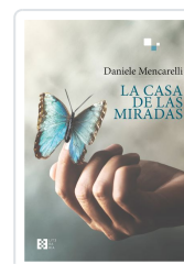
LA CASA DE LAS MIRADAS DANIELE MENCARELLI