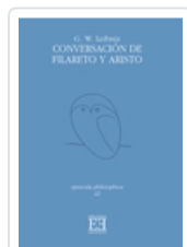
CONVERSACIÓN DE FILARETO Y ARISTO G.W. LEIBNIZ