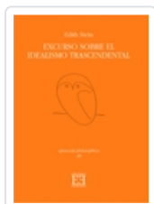
EXCURSUS SOBRE EL IDEALISMO TRASCENDENTAL EDITH STEIN