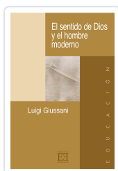
EL SENTIDO DE DIOS Y EL HOMBRE MODERNO GIUSSANI, LUIGI