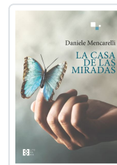
LA CASA DE LAS MIRADAS DANIELE MENCARELLI