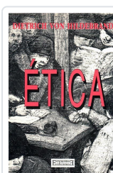
ÉTICA HILDEBRAND, DIETRICH VON