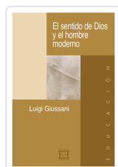
EL SENTIDO DE DIOS Y EL HOMBRE MODERNO GIUSSANI, LUIGI