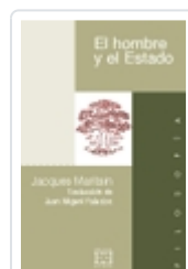
EL HOMBRE Y EL ESTADO JACQUES MARITAIN