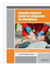
ATENCIÓN SANITARIA INICIAL EN SITUACIONES DE EMERGENCIA GARCÍA PÉREZ, ESTER