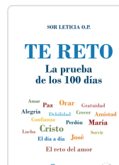
TE RETO. LA PRUEBA DE LOS 100 DÍAS AA.VV.