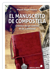
EL MANUSCRITO DE COMPOSTELA MIGUEL ANGEL VELASCO