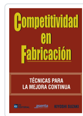
COMPETITIVIDAD EN FABRICACIÓN KIYOSHI SUZAKI