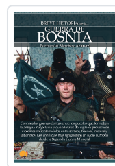
BREVE HISTORIA DE LA GUERRA DE BOSNIA SÁNCHEZ ARANAZ, FERNANDO