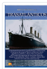
BREVE HISTORIA DE LOS TRASATLÁNTICOS SAN JUAN SÁNCHEZ, VÍCTOR