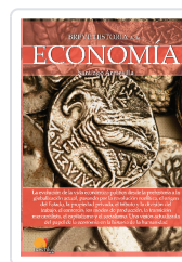
BREVE HISTORIA DE LA ECONOMÍA ARMESILLA CONDE, SANTIAGO JAVIER