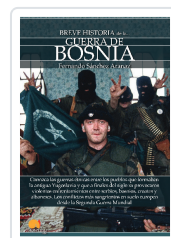
BREVE HISTORIA DE LA GUERRA DE BOSNIA SÁNCHEZ ARANAZ, FERNANDO