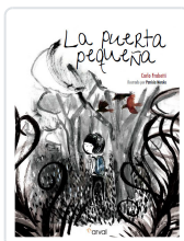
LA PUERTA PEQUEÑA FRABETTI, CARLO