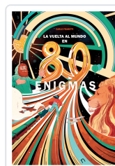
LA VUELTA AL MUNDO EN 80 ENIGMAS FRABETTI, CARLO