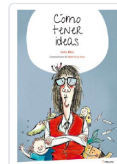
CÓMO TENER IDEAS RHEI, SOFÍA