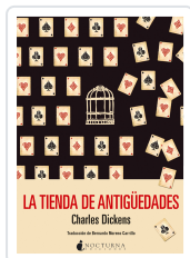
LA TIENDA DE ANTIGÜEDADES DICKENS, CHARLES