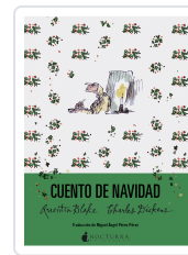
CUENTO DE NAVIDAD DICKENS, CHARLES