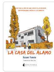
LA CASA DEL ÁLAMO YUMOTO, KAZUMI