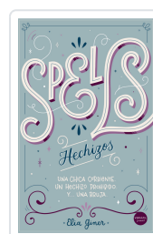
SPELLS (HECHIZOS) GINER, ELIA