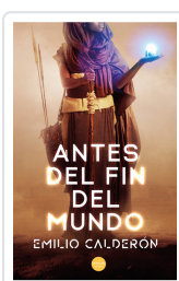
ANTES DEL FIN DEL MUNDO EMILIO CALDERÓN