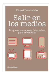
SALIR EN LOS MEDIOS PERALTA MAS, MIQUEL