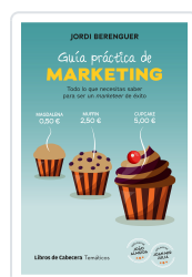
GUÍA PRÁCTICA DE MARKETING BERENGUER VALL-LLOBERA, JORDI