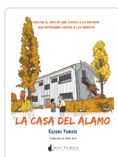
LA CASA DEL ÁLAMO YUMOTO, KAZUMI