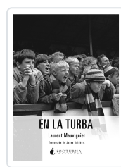
EN LA TURBA MAUVIGNIER, LAURENT