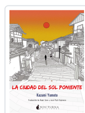
LA CIUDAD DEL SOL PONIENTE YUMOTO, KAZUMI