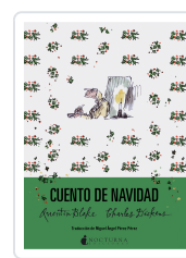
CUENTO DE NAVIDAD DICKENS, CHARLES