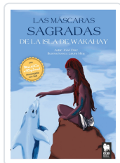
LAS MASCARAS SAGRADAS DE LA ISLA DE WAKAHAY DÍAZ SERRANO, JOSE