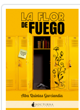
LA FLOR DE FUEGO QUINTAS GARCÍANDÍA, ALBA