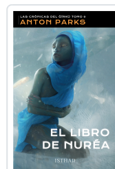
EL LIBRO DE NURÉA PARKS, ANTON