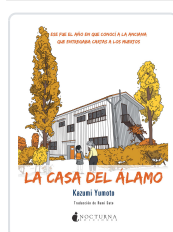
LA CASA DEL ÁLAMO YUMOTO, KAZUMI