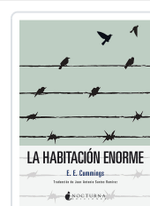
LA HABITACIÓN ENORME CUMMINGS, EDWARD ESTLIN