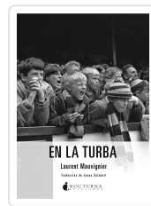
EN LA TURBA MAUVIGNIER, LAURENT