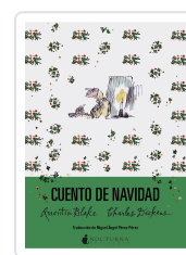
CUENTO DE NAVIDAD DICKENS, CHARLES