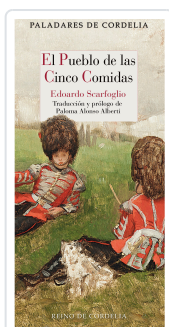
EL PUEBLO DE LAS CINCO COMIDAS SCARFOGLIO, EDOARDO