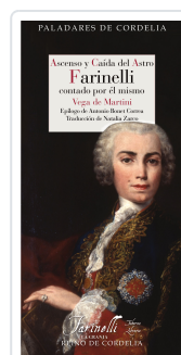
ASCENSO Y CAÍDA DEL ASTRO FARINELLI CONTADO POR EL MISMO MARTINI, VEGA