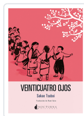
VEINTICUATRO OJOS TSUBOI, SAKAE