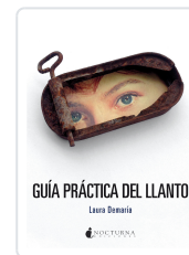
GUÍA PRÁCTICA DEL LLANTO DEMARIÁ, LAURA