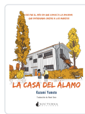
LA CASA DEL ÁLAMO YUMOTO, KAZUMI