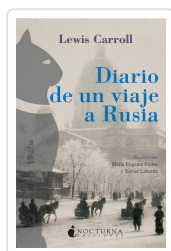
DIARIO DE UN VIAJE A RUSIA CARROLL, LEWIS