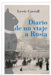
DIARIO DE UN VIAJE A RUSIA CARROLL, LEWIS