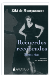
RECUERDOS RECUPERADOS. MEMORIAS KIKI DE MONTPARNASSE