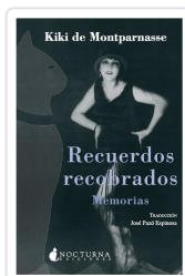
RECUERDOS RECOBRADOS. MEMORIAS KIKI DE MONTPARNASSE