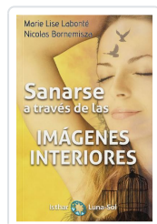
SANARSE A TRAVÉS DE IMÁGENES INTERIORES LABONTÉ, MARIE LISE