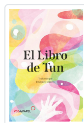
EL LIBRO DE TUN SEGARRA, FRANCISCO