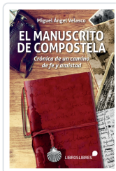
EL MANUSCRITO DE COMPOSTELA MIGUEL ANGEL VELASCO