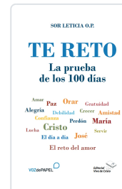
TE RETO. LA PRUEBA DE LOS 100 DÍAS AA.VV.