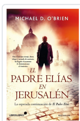
EL PADRE ELÍAS EN JERUSALÉN O BRIEN, MICHAEL