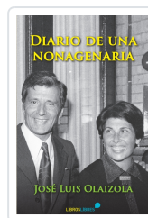
DIARIO DE UNA NONAGENARIA OLAIZOLA, JOSÉ LUIS