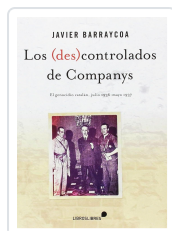
LOS (DES)CONTROLADOS DE COMPANYS JAVIER BARRYCOA