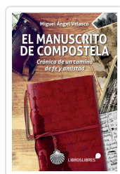
EL MANUSCRITO DE COMPOSTELA MIGUEL ANGEL VELASCO