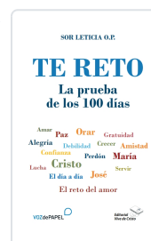
TE RETO, LA PRUEBA DE LOS 100 DÍAS AA.VV.