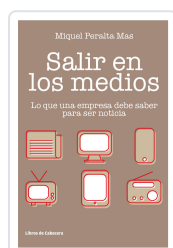
SALIR EN LOS MEDIOS PERALTA MAS, MIQUEL