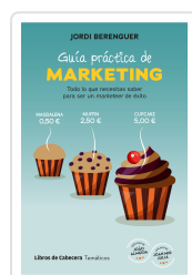
GUÍA PRÁCTICA DE MARKETING BERENGUER VALL-LLOBERA, JORDI