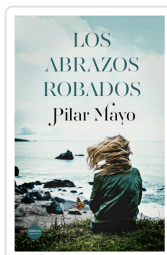
LOS ABRAZOS ROBADOS MAYO, PILAR