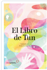
EL LIBRO DE TUN SEGARRA, FRANCISCO