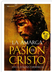
LA AMARGA PASION DE CRISTO (14ª ED.) ANA CATALINA EMMERICH