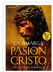
LA AMARGA PASION DE CRISTO (14ªED.) ANA CATALINA EMMERICH