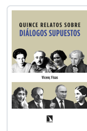
QUINCE RELATOS SOBRE DIÁLOGOS SUPUESTOS FISAS ARMENGOL, VICENÇ