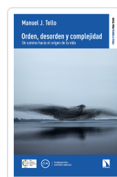
ORDEN, DESORDEN Y COMPLEJIDAD J. TELLO, MANUEL