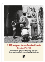
EL SUT, IMÁGENES DE UNA ESPAÑA DIFERENTE GONZÁLEZ DE AGUILAR, ÁLVARO