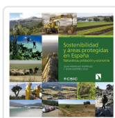
SOSTENIBILIDAD Y ÁREAS PROTEGIDAS EN ESPAÑA RODRÍGUEZ RODRÍGUEZ, DAVID/MARTÍNEZ VEGA, JAVIER