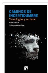
CAMINOS DE INCERTIDUMBRE PRADA, ALBINO