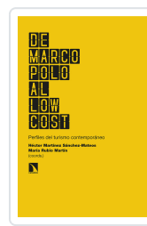
DE MARCO POLO AL LOW COST MARTÍNEZ SÁNCHEZ-MATEOS, HÉCTOR/RUBIO MARTÍN, MARÍA