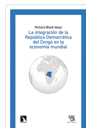
LA ECONOMÍA DE LA REPÚBLICA DEMOCRÁTICA DEL CONGO BILADI ABASI, RICHARD